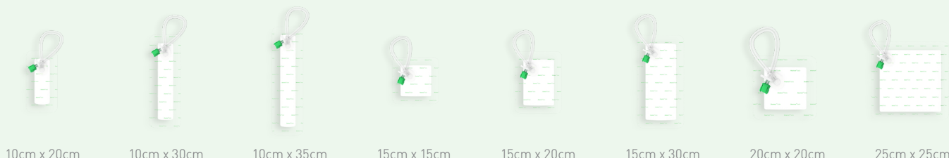
10cm x 20cm

Avance Solo NPWT brukes for å fjerne lite til store mengder væske fra kroniske, akutte, traumatiske, subakutte og åpne sår, samt grafter og lappeplastikk.